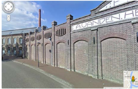
Schoenfabriek Best (staat in Geldrop)