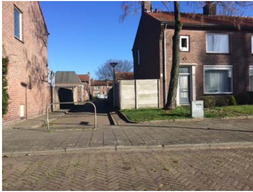
Geldrop Huis Ouders Albert