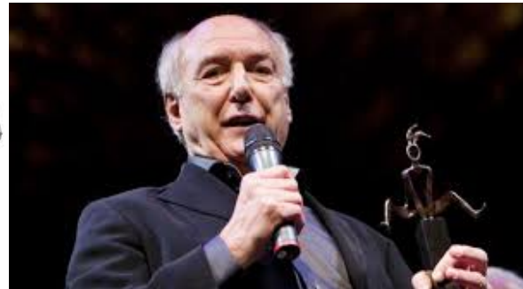
Viswinkel Koelewijn Eindhoven